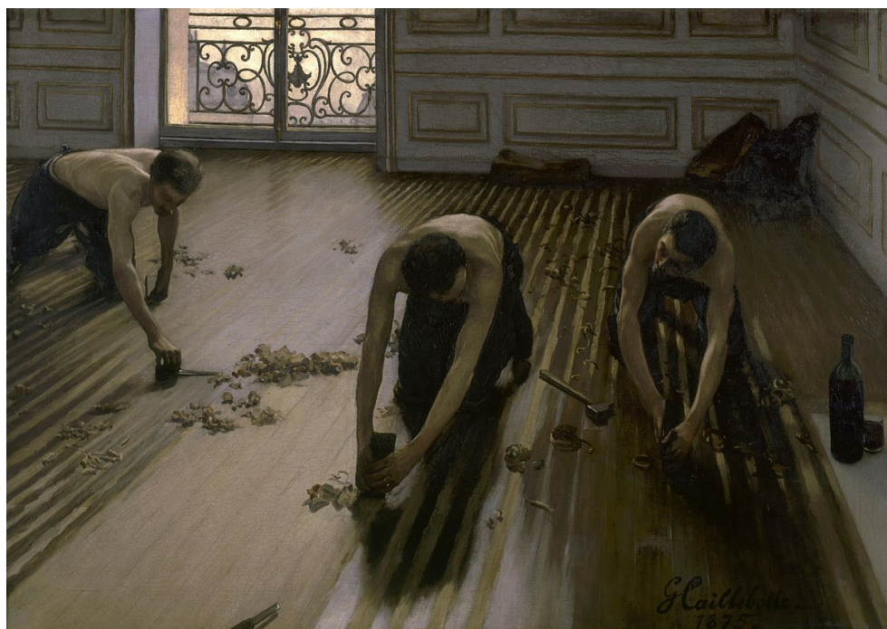
Gustave Caillebotte, Les raboteurs de parquet , 1875, Huile sur toile, 146,5*102, Musée d'Orsay

Le tableau que nous avons préféré lors de cette visite est celui de Caillebotte intitulé les Raboteurs de parquet car nous avons apprécié son réalisme. Ce tableau représente des hommes qui poncent le plancher d'un hôtel particulier, ils sont représentés de façon héroïque. C'est un travail très précis peint avec de la peinture à l'huile. La composition de l'œuvre est très photographique.