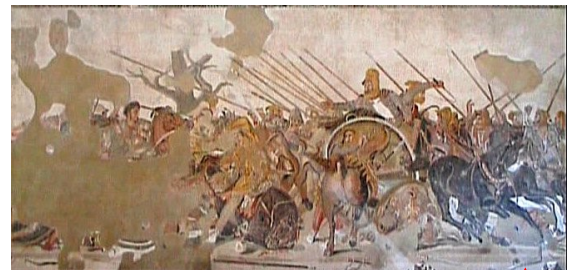
Mosaïque de la bataille d'Alexandre