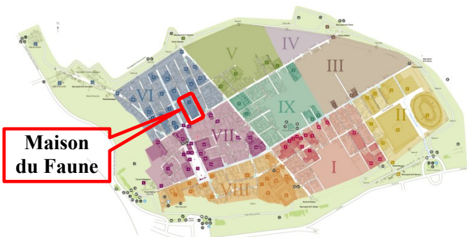
Maison du Faune

La maison du Faune a été construite entre le 5ème et le 1er siècle avant J.-C. Elle a été découverte et fouillée par Antonio Bonucci entre 1830 et 1832.